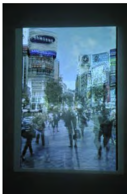
【貸出画像3】 ヤマガミユキヒロ 《Ghost City》2010