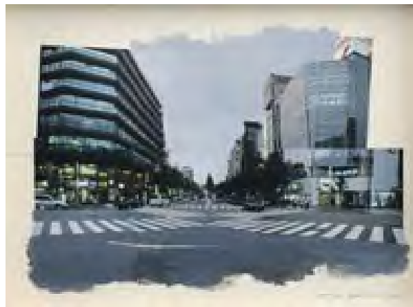
【貸出画像4】 ヤマガミユキヒロ 《Nocturne (study)》 2009